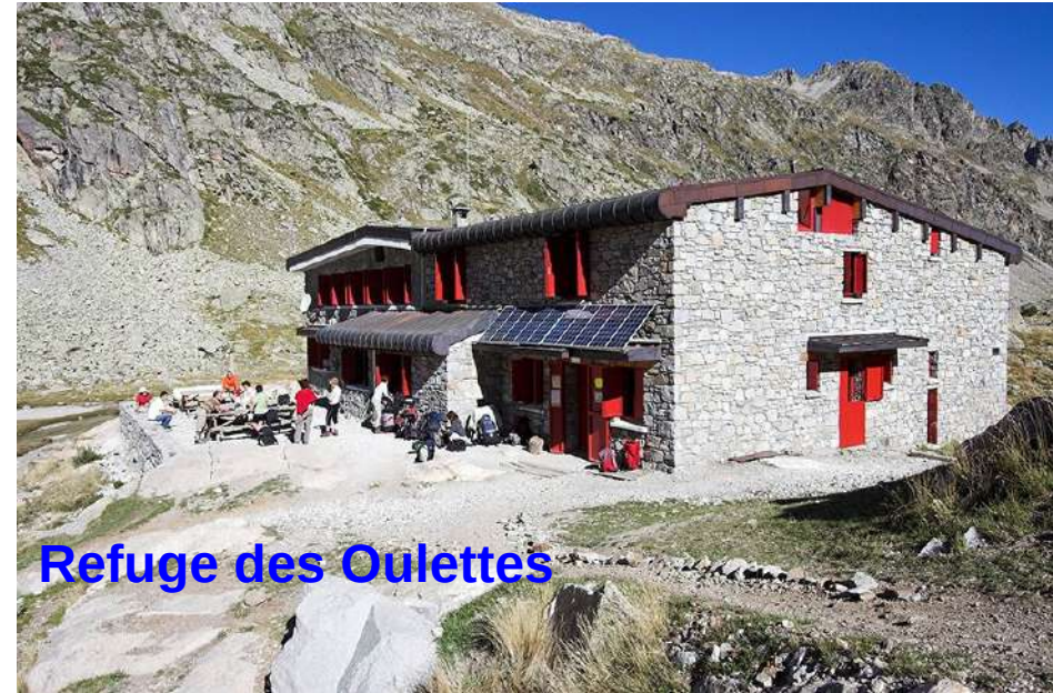
Refuge des Oulettes